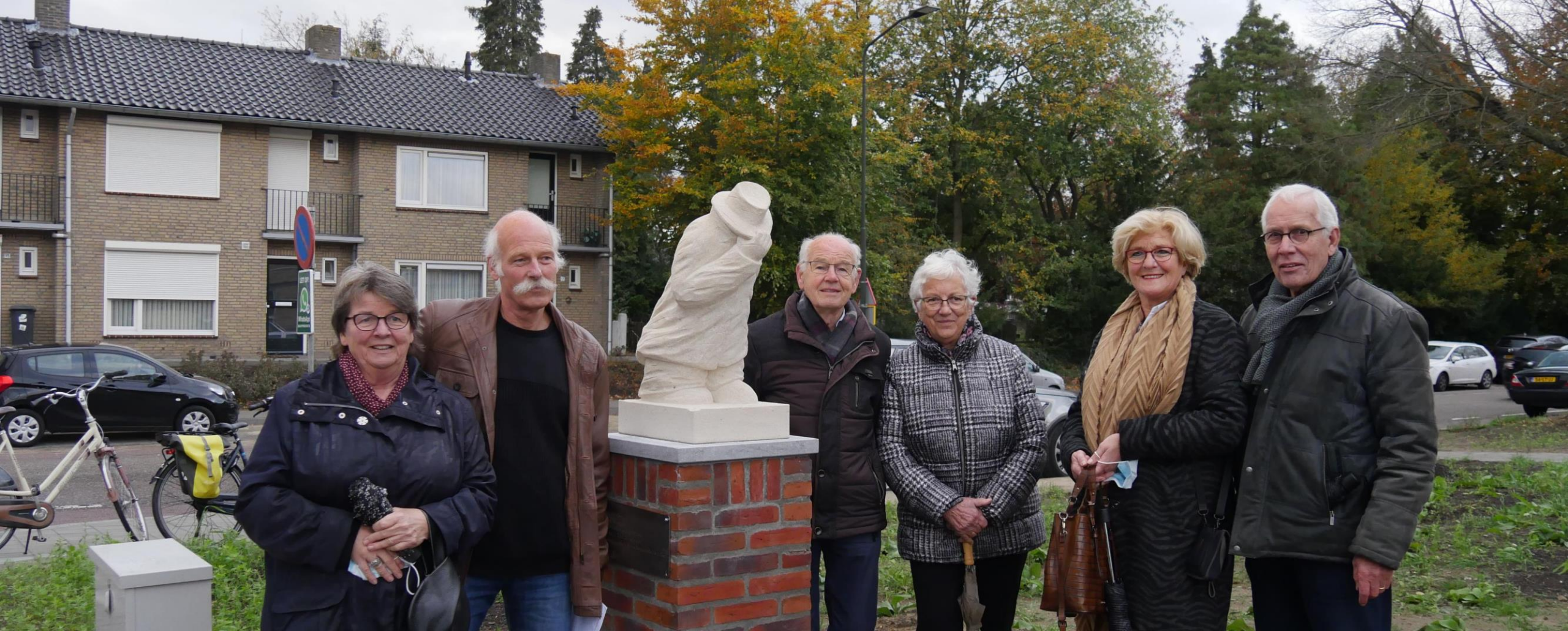
Opening Jan Heurkensstraat in Geldrop, september 2019